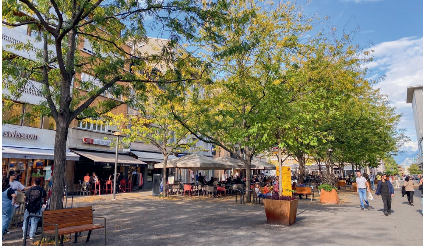
La Place du Midi, artère principale de Sion, deviendra une grande zone piétonnière pendant la Fête et le concours des apprentis romands.