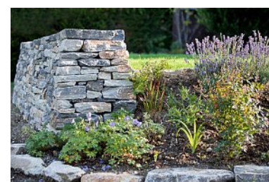
Murs de pierre sèche espacés en hauteur (en haut) ou mur unique (ci-dessus).