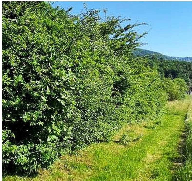
Photos prise à L'Abergement, dans le jardin sauvage. A gauche une haie fruitière (sureau, cornouiller, noisetier, etc.). A droite un nashi avec, à son pied, de la rhubarbe et des fraises des bois. DR

La haie fruitière, comme une haie standard, se trouve généralement en bordure de jardin. Elle permet de dé-