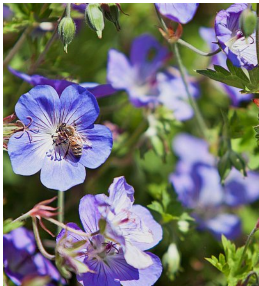
Un parterre de géraniums vivaces.