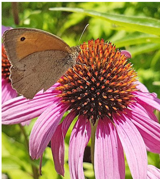
Une échinacée attire un papillon.