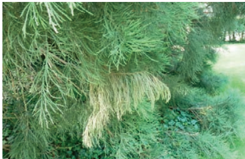
Figure 3 Décoloration verte claire des rameaux contrastant avec le vert sombre habituel.