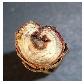
Figure 8 Coupe transversale d'une branche atteinte, avec nécrose imbibée de résine.