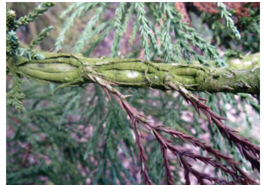
Figure 6 Nécroses sur branche.