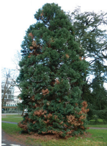
Figure 2 Atteintes éparses de la couronne d'un séquoia géant.