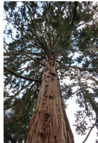
Figure 5 La couronne de l'arbre, élaguée naturellement de ses rameaux secs, apparaît clairsemée.