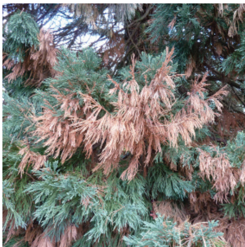
Figure 4 Brunissement des rameaux atteints.